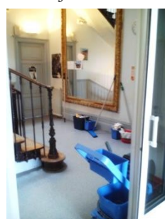
Atelier Entretien des locaux