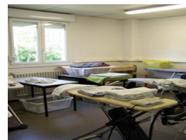
Atelier Entretien du linge horticulture