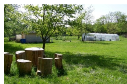
Espaces verts et